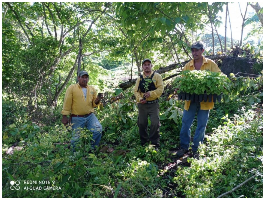
Integrantes de brigada regional JICOSUR 1 acercando la planta para reforestación en predio "La Barbería", Villa Purificación.