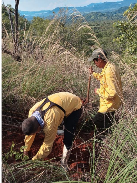
Integrantes de Brigada Regional JICOSUR 1 durante la reforestación de "La Toma", Villa Purificación.