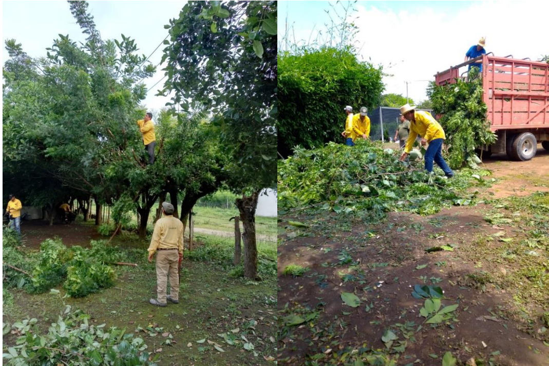
Elementos de JICOSUR 1 durante las tareas de poda de árbol adulto en vivero forestal Villa Purificación.

Continuando, si bien es cierto que en el pasado informe "2DO informe trimestral" se mencionó sobre la posibilidad de que la brigada regional JICOSUR 3 tendría la posibilidad de realizar tareas de prevención física , se informa al cierre del presente informe, la determinación de que dicha brigada no realizará esa extensión de tareas, por lo que Regional JICOSUR 3 cierra sus actividades de este convenio, se ANEXAN finiquitos.