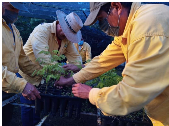
Integrantes de Brigadas Regionales de JICOSUR en vivero forestal Villa Purificación durante acarreo y acomodo de planta para reforestación.