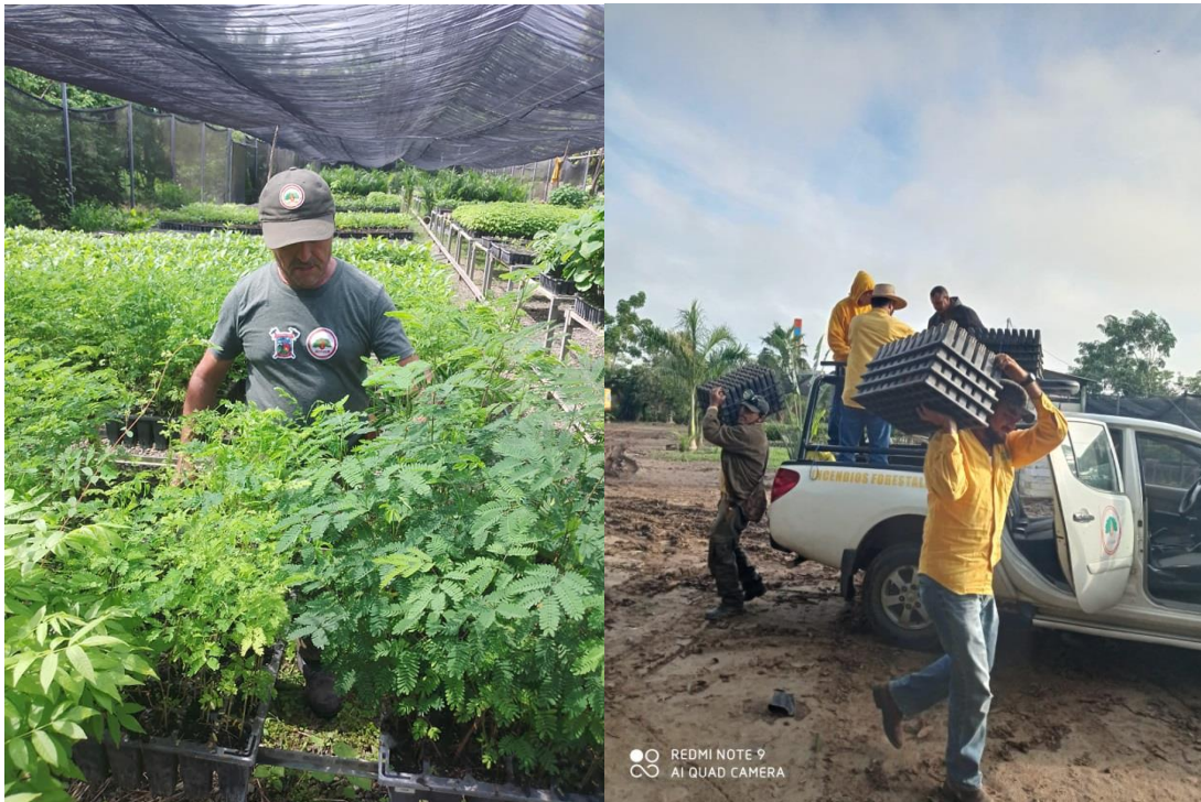
Elementos de JICOSUR 1 durante las tareas en viveros forestales La Huerta y Villa Purificación.