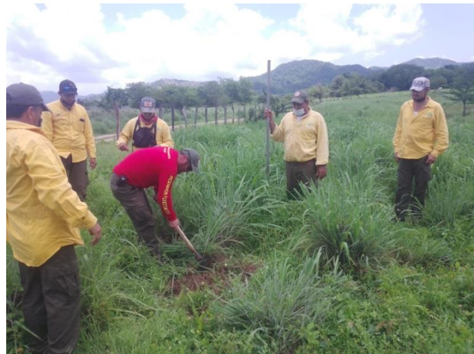
Coordinador de manejo de fuego y Brigada Regional JICOSUR 1 durante tareas de marcado y apertura de cepas.