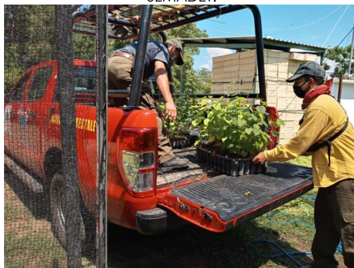
Brigada JICOSUR 1, durante acarreo de planta para iniciar la temporada de restauración.