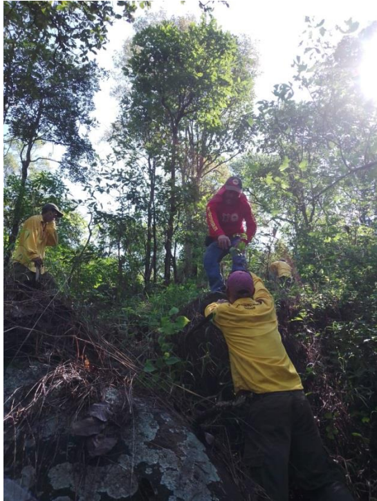
Integrantes de Brigada Regional JICOSUR 2 durante la reforestación de "El Durazno", Cuautitlán de G.B., y "La Toma", Villa Purificación respectivamente.