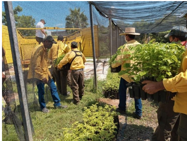
En vivero forestal La Huerta, durante el acarreo de planta para CONAFOR y SEMADET.

En cuanto al acarreo de la planta, se llevó a cabo una coordinación de JICOSUR y los viveros forestales, La Huerta y Villa Purificación, de tal forma que se fue disponiendo de la planta conforme el avance en las actividades de campo y al ritmo de la prospección de los sitios a intervenir. Es importante señalar que la gestión y disposición de planta local ayudó a fortalecer la colaboración interinstitucional en la región, ya que de esta gestión tanto CONAFOR como SEMADET pudieron establecer metas de reforestación en Tomatlán empleando sus brigadas Delta 07 y Caobas, respectivamente, y en sitios donde previamente JICOSUR y el H. Ayto. de Tomatlán habían acordado.