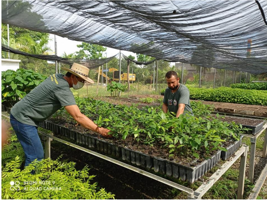
Elementos de JICOSUR 1 durante las tareas en viveros forestales La Huerta y Villa Purificación.