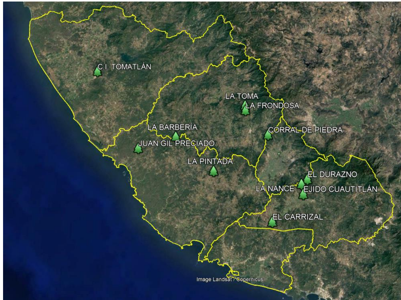
Ubicación de parajes con restauración 2021.

De las actividades de reforestación se ANEXA, memoria fotográfica, sitios de trabajo en .kml, cartas compromiso de los dueños de las zonas trabajo y ACUSE de informe ante SEMADET.