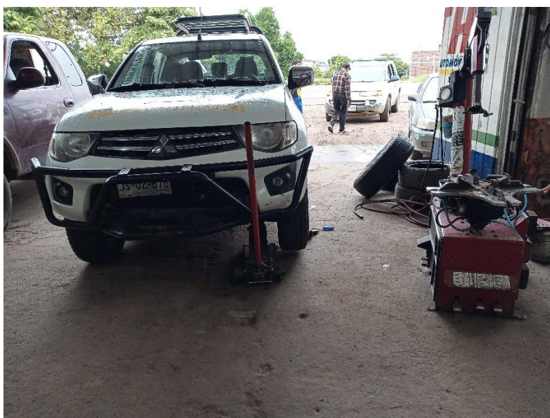
La unidad Mitsubishi L200 combustión a Diesel con placas JS02676, recibe servicio de cambio de rodado.

Cabe señalar que de las dos unidades pick up Mitsubishi L200 combustión a Diesel entregadas a comodato a JICOSUR, una de ellas también tuvo servicio de cambio de rodado, ya que con el que contaba cuando se recibió de SEMADET, mostraba desgaste excesivo para las tareas futuras a las que se destina la unidad. Por lo anterior, se informa que la unidad Mitsubishi L200 combustión a Diesel placas JS02676 se cambió rodado de 4 piezas con características todo terreno. Este cambio fue de vehículo a vehículo y la inversión fue específicamente en el servicio de montado y balanceo.