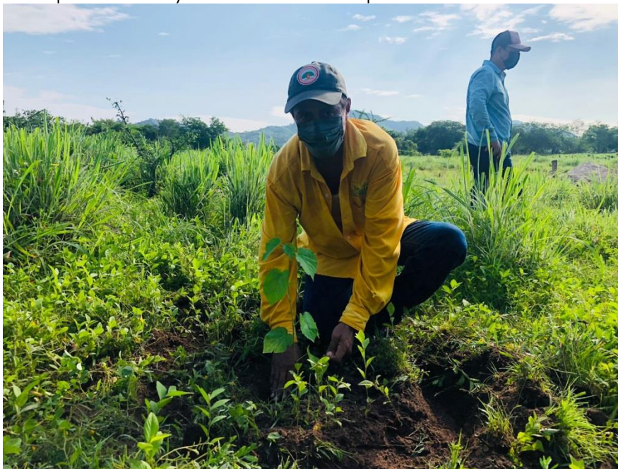
Integrante de Brigada Regional JICOSUR 1 durante la reforestación de "La Pintada", La Huerta.