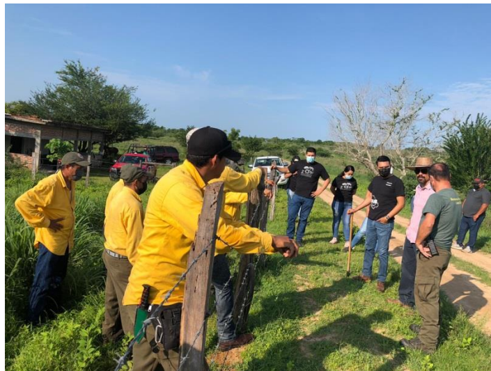
Tareas de reforestación en el predio "La Pintada", La Huerta.

Como parte del proceso de formalización con los dueños y poseedores de la tierra a restaurar, se generó una carta compromiso, donde el dueño de la tierra se compromete a proteger y mantener en óptimas condiciones el sitio reforestado por lo menos en los próximos 2 años.