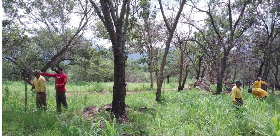
El coordinador regional y elementos de brigadas regionales JICOSUR, durante tareas de reforestación 2021.