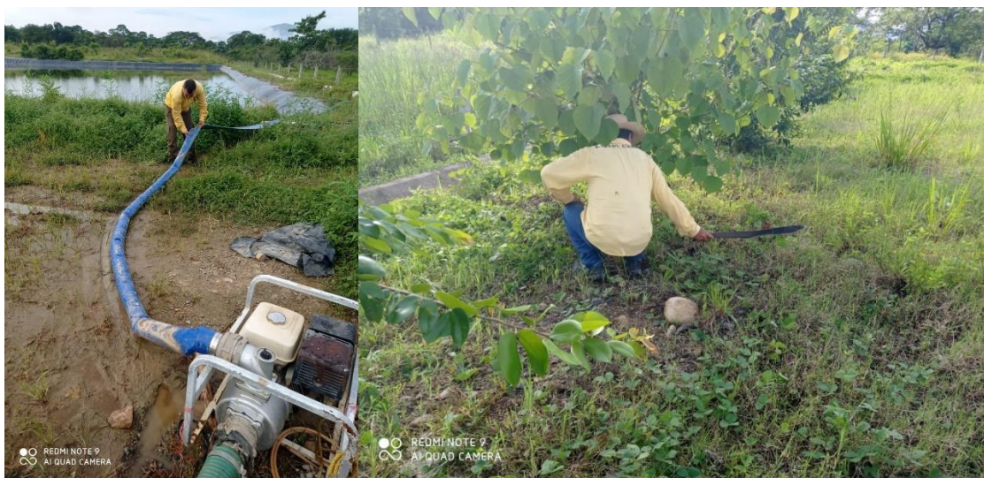
Integrantes de brigada regional JICOSUR 1 durante tareas en relleno subregional de Villa Purificación.

Prosiguiendo con las tareas desarrolladas por las brigadas regionales y como parte del calendario de contratación que anteriormente se señaló, es la Brigada JICOSUR 1 (Base de operaciones Juan Gil Preciado, La Huerta), quien continúa con trabajos de limpieza y extracción de agua en el Relleno Sanitario Sub regional ubicado en Villa Purificación. Las tareas fueron realizadas durante 12 días del mes de septiembre, si bien y como lo señala el contrato vigente de esta brigada, su contrato concluye para el 28 de septiembre, ellos trabajaron hasta el 12 del ese mes, ya que el resto de los días que señala su contrato los tomaron como días de descanso por las horas extras generadas durante la temporada de incendios.