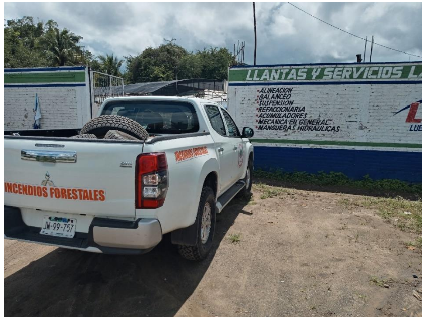
Unidad marca Mitsubishi, modelo L200 versión 4x4 con placas JW99757 durante el cambio de rodado.

Cabe señalar que de las dos unidades pick up Mitsubishi L200 combustión a Diesel entregadas a comodato a JICOSUR, una de ellas también tuvo servicio de cambio de rodado, ya que con el que contaba cuando se recibió de SEMADET, mostraba desgaste excesivo para las tareas futuras a las que se destina la unidad. Por lo anterior, se informa que la unidad Mitsubishi L200 combustión a Diesel placas JS02676 se cambió rodado de 4 piezas con características todo terreno. Este cambio fue de vehículo a vehículo y la inversión fue específicamente en el servicio de montado y balanceo.