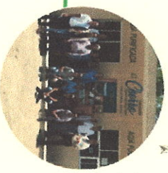
Mejoramiento de la calidad de agua