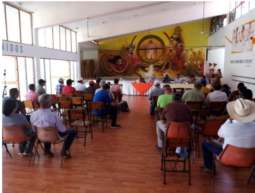
En la imagen, sesión de Consejo Municipal de Desarrollo Rural Sustentable en C. Castillo. 20 de febrero del 2020.