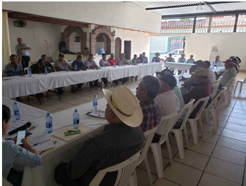
En las imágenes anteriores, sesión de Consejo Municipal de Desarrollo Rural Sustentable con sede en Villa Purificación el día 18 de febrero del 2020