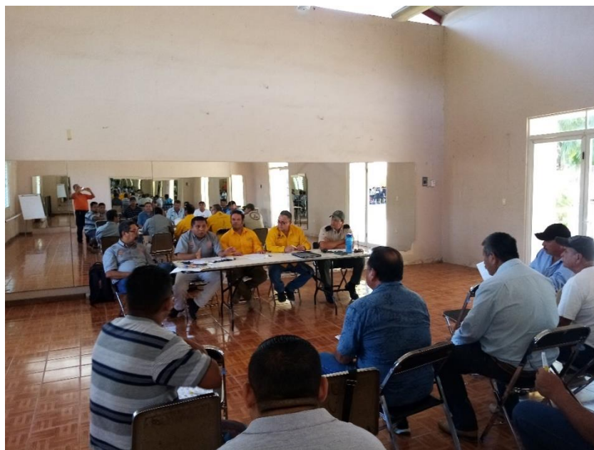
En la imagen, sesión de Consejo Municipal de Desarrollo Rural Sustentable en Cihuatlán, dicha sesión tuvo fecha el día 04 de marzo del presente año. Cabe señalar que para esta sesión se aprovecha abordar el tema de la Difusión de la NOM-015-SEMARNAT/SAGARPA y el establecimiento del calendario de quema municipal.