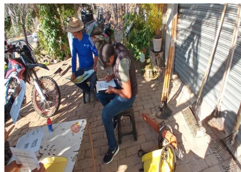
Imagen 10: Firma de contratos brigadas regionales JICOSUR