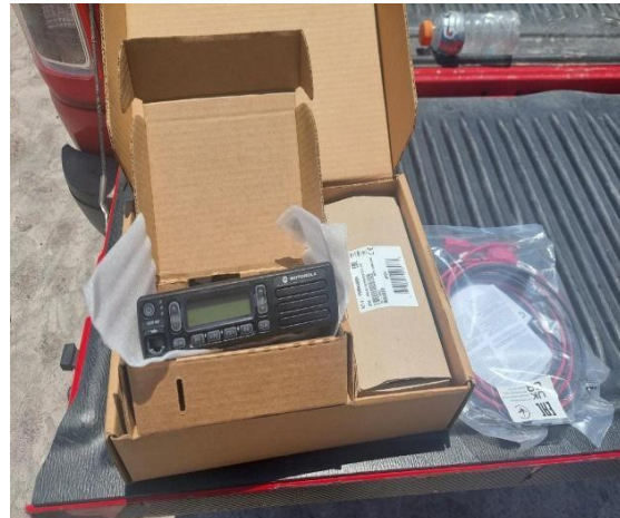
Ilustración 6: Radios Motorola portátil y móvil.