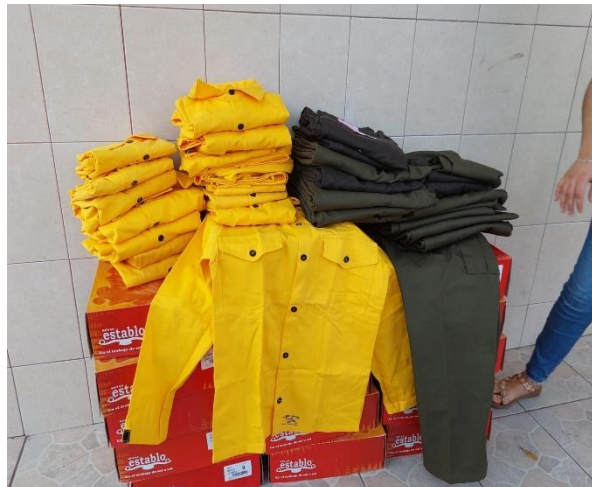
Ilustración 2: Equipo de protección personal