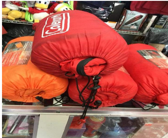
Ilustración 4: Sleepin Coleman