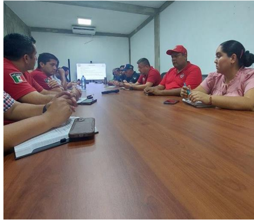
Ilustración 13: Sección municipal de protección civil y dependencias gubernamentales.