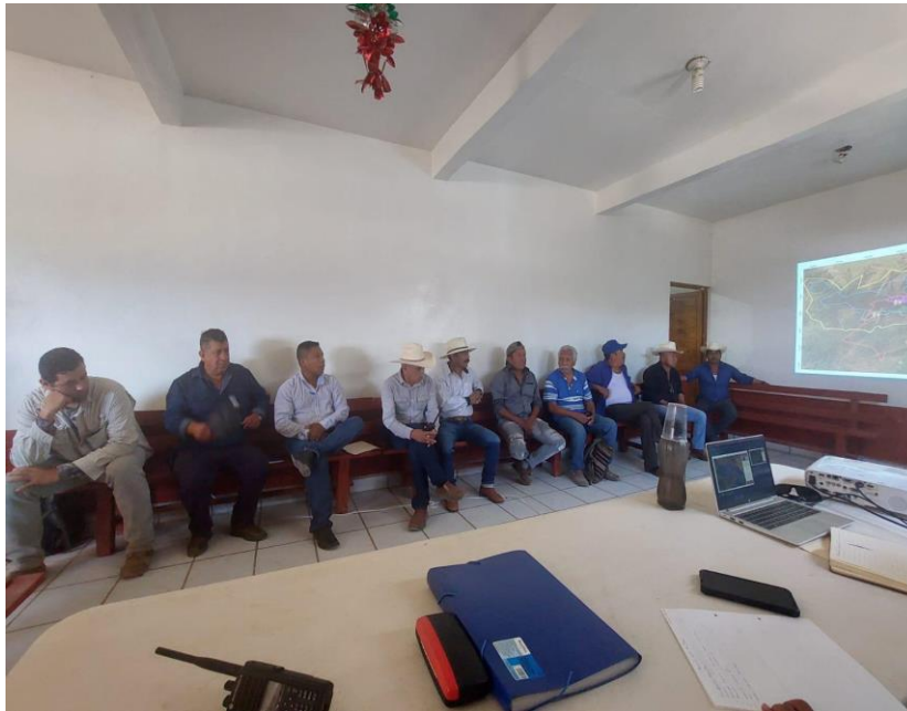
Ilustración 12: Reunión institucional en Casa Ejidal de Ayotitlán.

El técnico especializado en manejo del fuego de la JICOSUR, atiende la convocatoria y participa en la segunda reunión para unidades municipales que se realizó en la Comandancia Regional N° 2 "Costa Sur", sede instalaciones UEPCBJ. Algunos de los temas que se atendieron fueron: