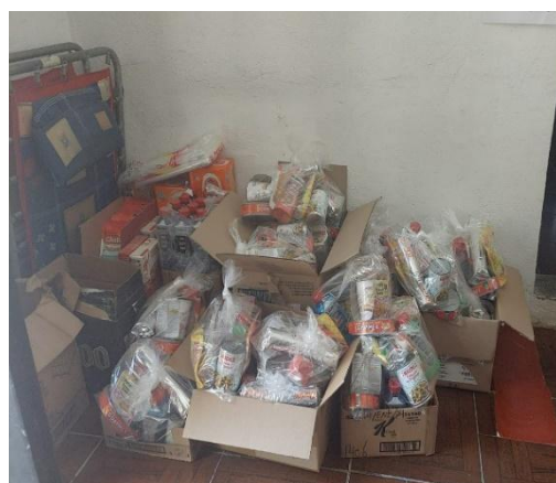
Ilustración 1: Stock de alimentación no perecederos.