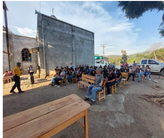
Ilustración 7: Conocimientos de trabajos en ejidos prioritarios. Ilustración 8: Socialización con ejidos y comunidades

Con el trabajo en conjunto que se tuvo con los municipios de la JICOSUR sobre la difusión y prevención cultural y legal de los avisos y calendarios de quema, se obtuvo un total de 372 avisos de quema en la Región Costa Sur descritos por municipio en la siguiente tabla 05.