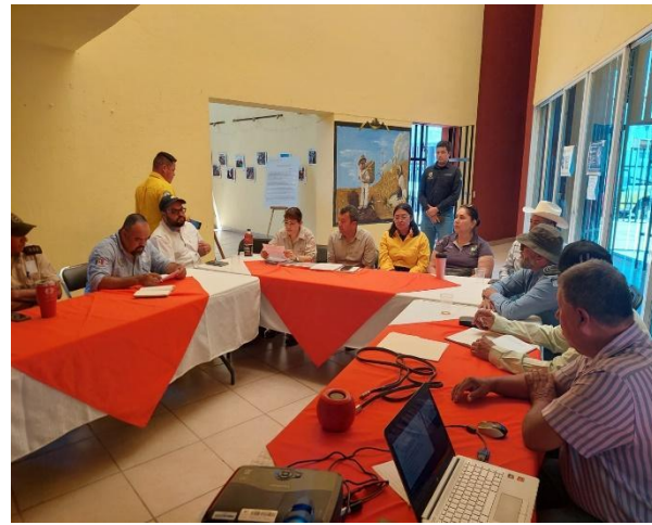
Ilustración 11: Revisión de estadísticas de incendios en la costa sur..