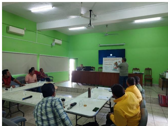
Ilustración 9: Sesión de comité regional de manejo del fuego de la costa sur municipio de Cihuatlán.