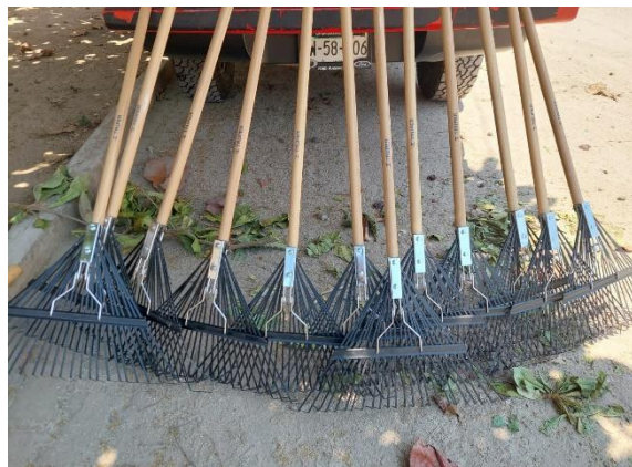
Ilustración 3: Herramientas manuales (escobas forestales).