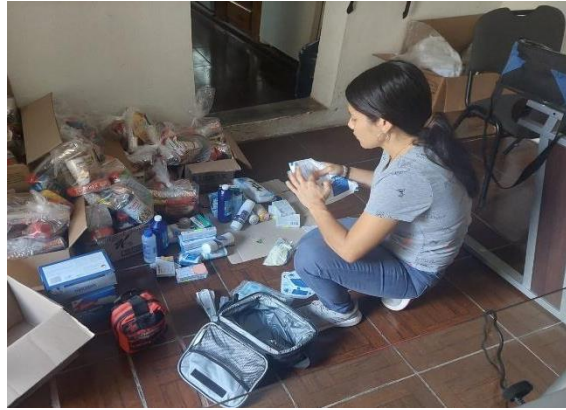
Ilustración 5: Stock de medicamentos de primeros auxilios.